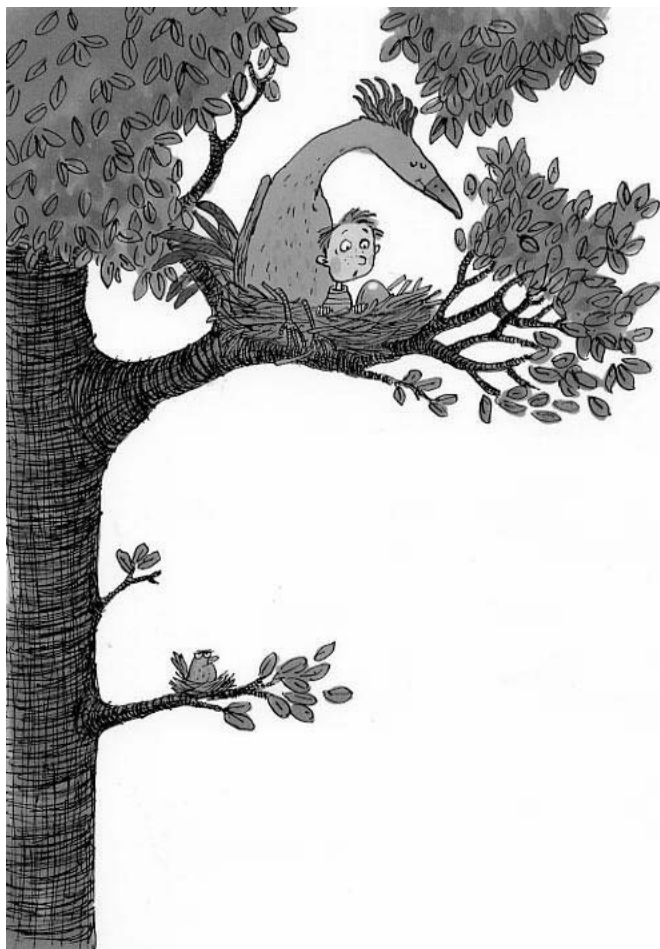
Kertomukset kuvittanut Christel Rönns