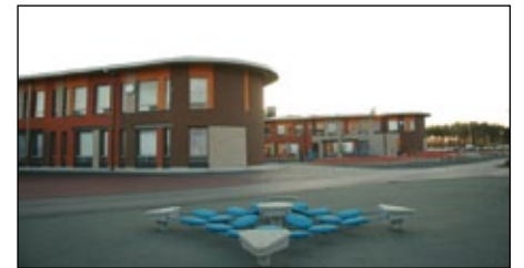
Koulu pihalta päin