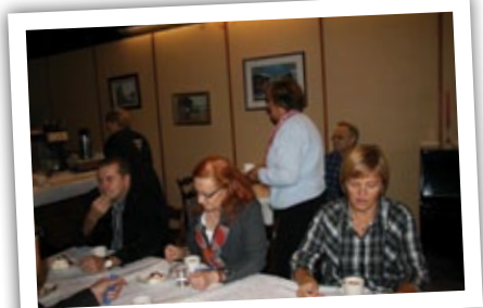
Toimijoita vuosien varrelta.