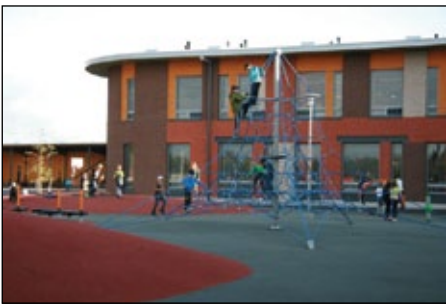
Lapsia leikkimässä pihalla

Ritaharjun uudessa koulussa vietettiin avointen ovien päivää maanantaina 6. syyskuuta. Paikalle oli tullut paljon vanhempia lapsineen. Itse rakennus ei juurikaan erotu ympäristöstään, mutta piha-alueelle tultaessa pitää heti hieraista silmiään - toinen toistaan upeampia pihavempaimia.