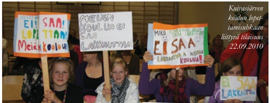
Kuivasjärven koulun lopettamisuhkaan liittyvä tilaisuus 22.09.2010